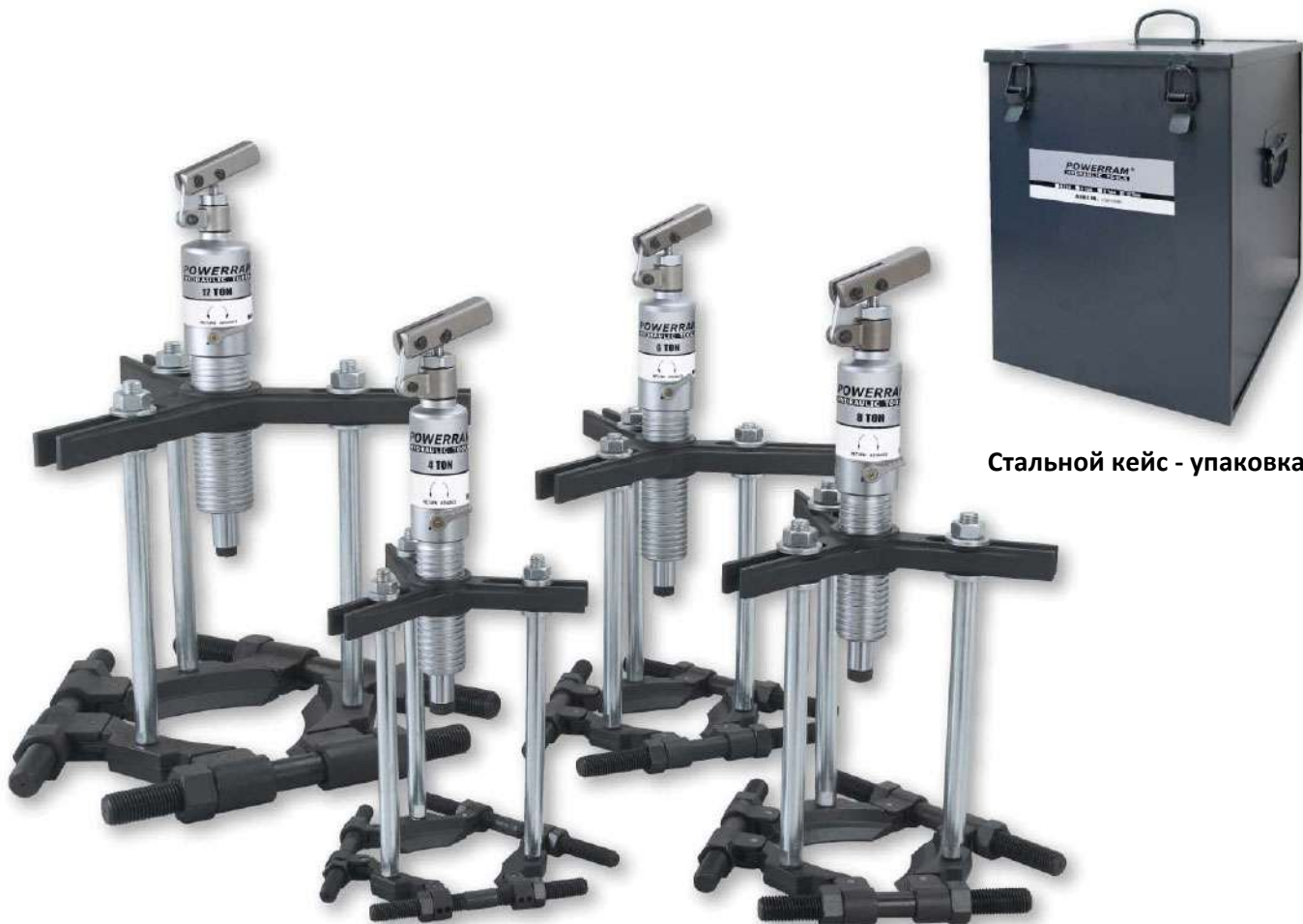
Стальной кейс - упаковка