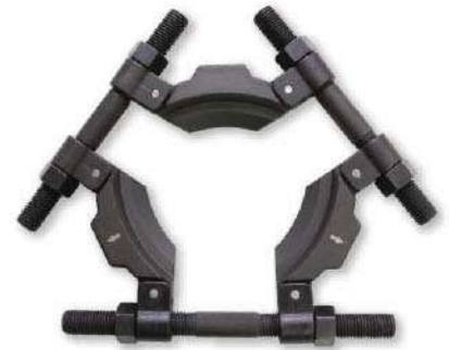
Прямая установка для стандартного применения