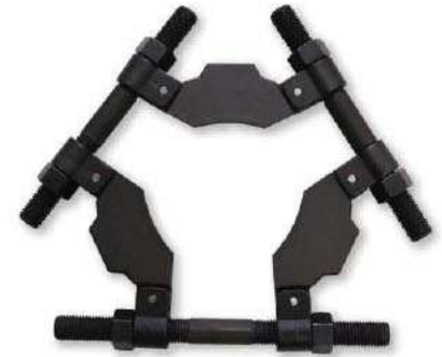
Обратная установка для самого широкого охвата